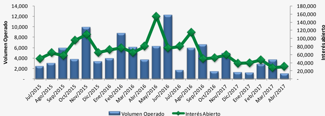
Futuro DC24 Volumen Promedio de Operación